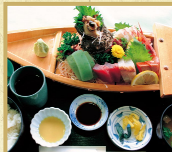
舟盛定食 2,400円 単品 2,100円