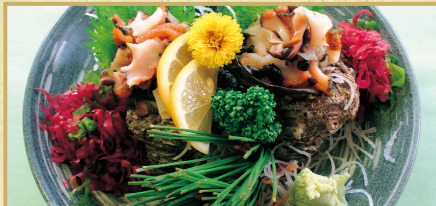
さざえの造り 2,000円 ※2~3個付けて約500gとなります