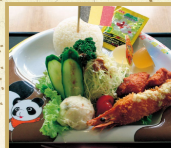
お子様ランチ 980円 ※ご注文は小学生以下とさせていただきます。