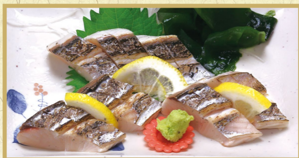
さわらのタタキ 1,400円