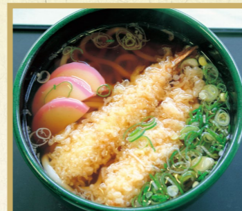
天ぷらうどんそば 1,200円