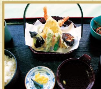
天ぷら定食 2,100円 単品 1,800円