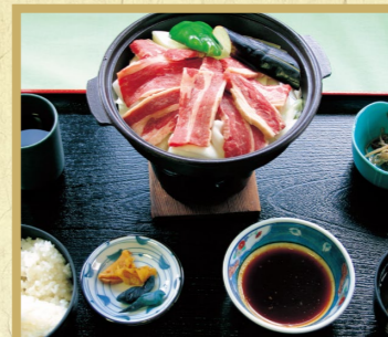
焼肉定食 2,100円 単品 1,800円