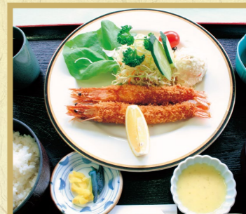
海老フライ定食 2,000円 単品 1,700円