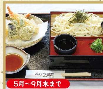
天ざるうどんそば 1,200円