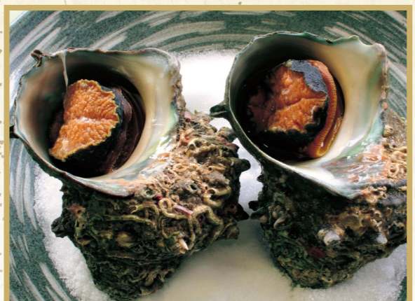
さざえの壺焼き 2,000円 ※2~3個付けて約500gとなります